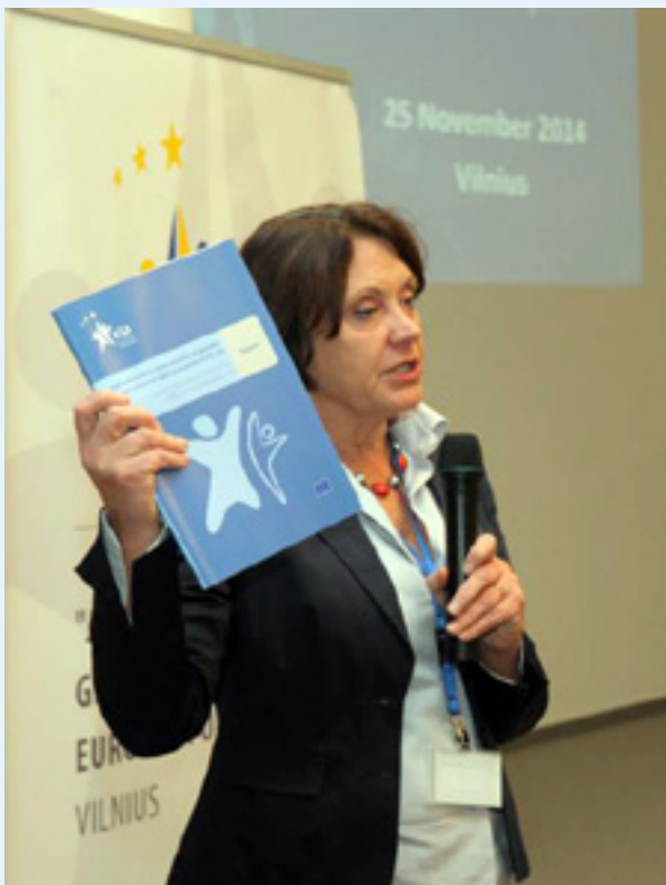
Virginija Langbakk, ravnateljica EIGE-a, za vrijeme svečanosti objavljivanja izvješća o izvorima administrativnih podataka o rodno utemeljenom nasilju u EU-u. EIGE, 25. studenoga 2014.